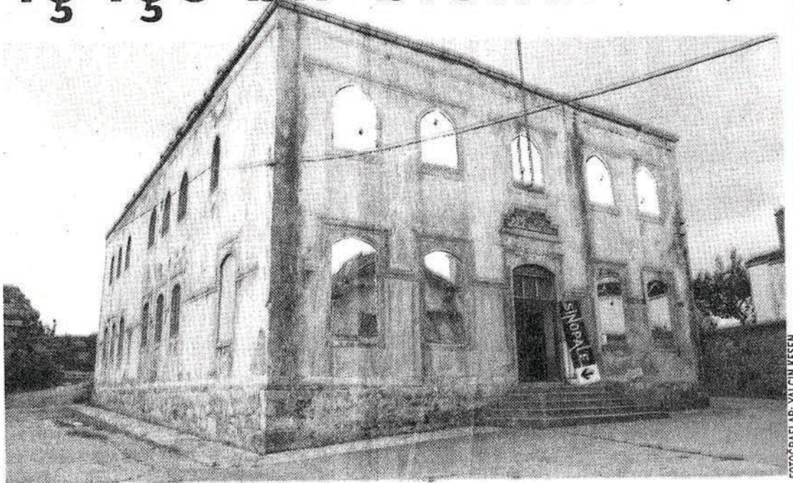
Tarihi Sinop Hapishanesi.